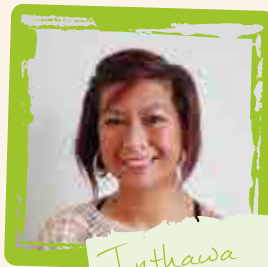
Inthawa Animatrice enfance